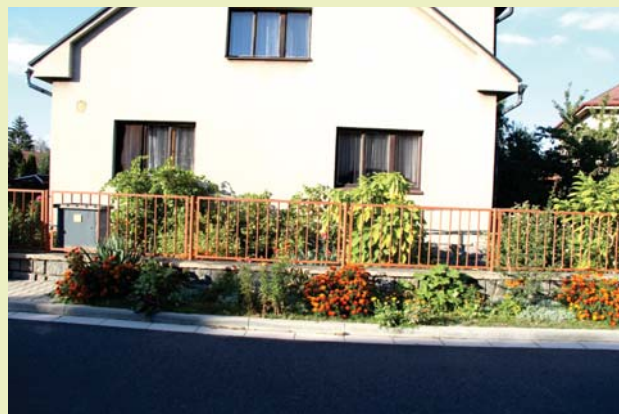
Předzahrádka v Tylově ulici v Uhlířských Janovicích